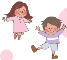
泉区民ふるさとまつり→