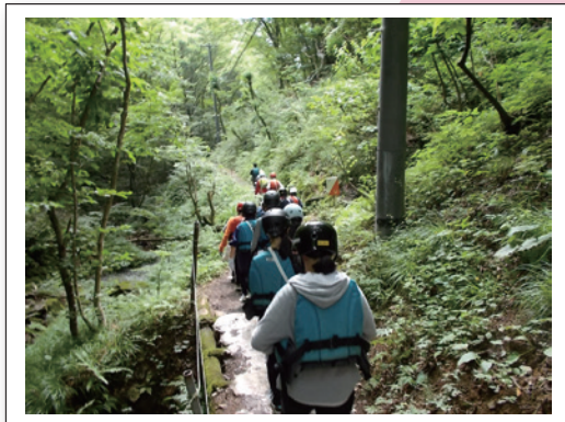
↑夏の泉っ子キャンプ