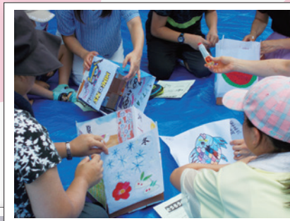
悠・遊フェスティバル→